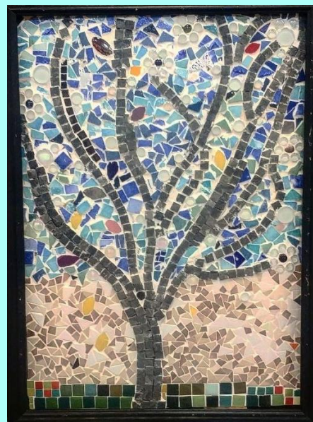
RÉALISÉE PAR JONATHAN